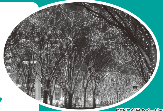
SENDAI光のページェント