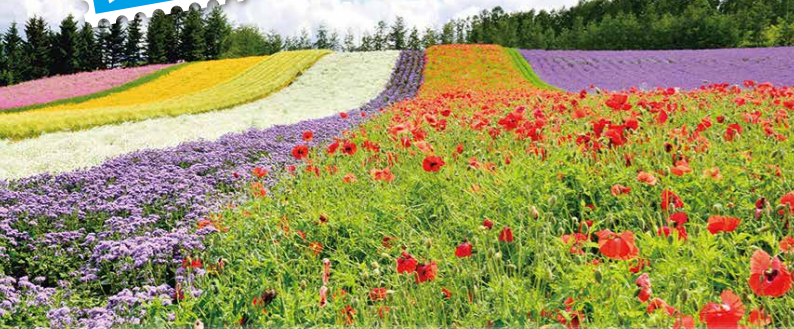
ファーム富田(7月頃)(AT)