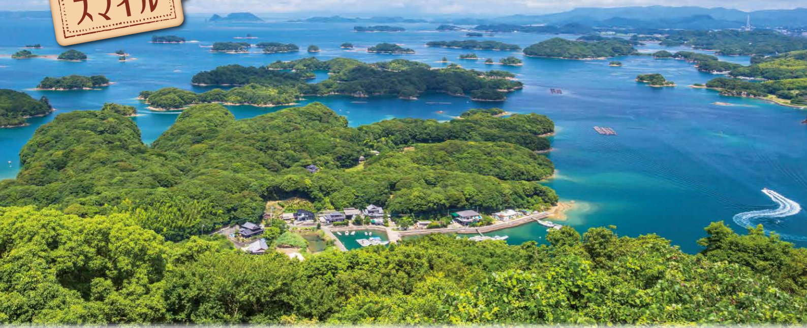
九十九島/イメージ(AT)