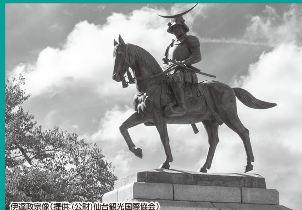
伊達政宗像