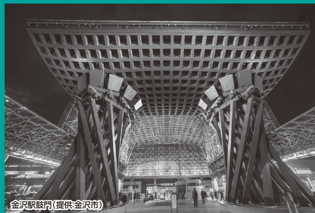
金沢駅鼓門